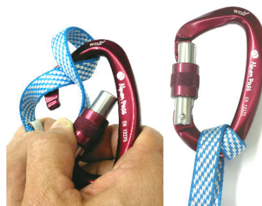
Figure 1 and 2 – always clip the carabiner through a double loop. Figuras 1 e 2 – sempre clipe o mosquetão por alça dupla.

Garantia – este produto tem garantia contra defeitos de fabricação de seis meses. A garantia não cobre usos indevidos, utilizações para as quais o produto não foi desenvolvido, ou o desgaste natural decorrente do uso.