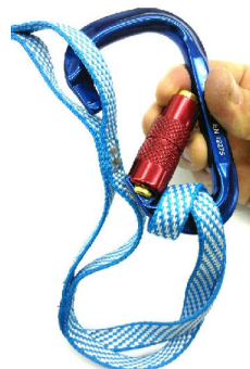
Figure 3 - Notice that the carabiner is connected to one end of the daisy chain with a double loop. OK! Figura 3 – note que o mosquetão está com laçada dupla em uma das extremidades da daisy chain. Correto !